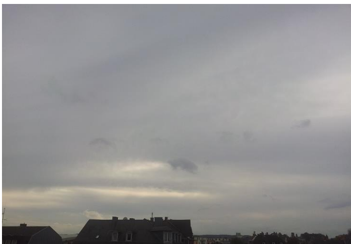
Slika 7