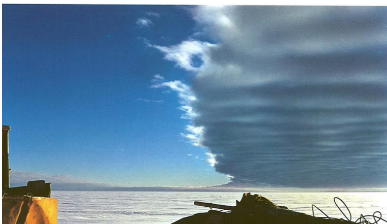
Slika 3