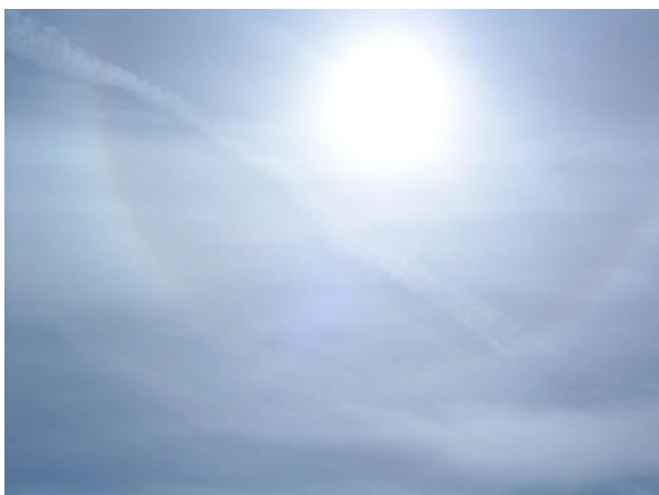
Slika 9