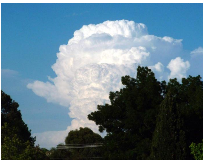
Slika 5