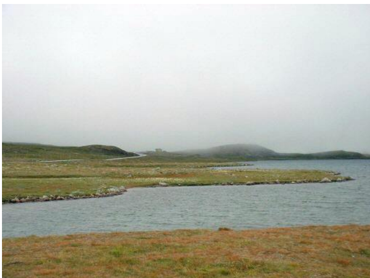
Slika 2