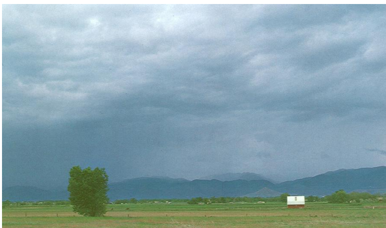
Slika 4