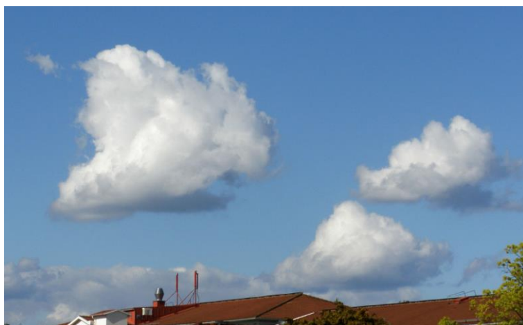
Slika 1