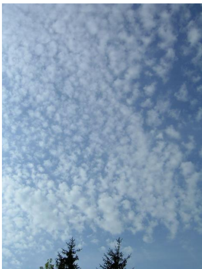
Slika 10