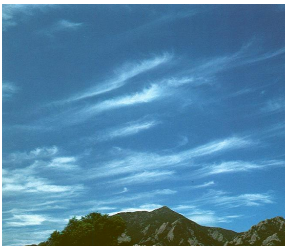
Slika 8